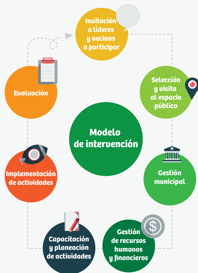
Gráfico 1. Modelo de intervención de la Feria por la paz y seguridad.

El manual está dirigido a líderes comunitarios, directores de grupos y educadores en general, interesados en promover la formación y participación ciudadana, a través de la recuperación y apropiación del espacio público.