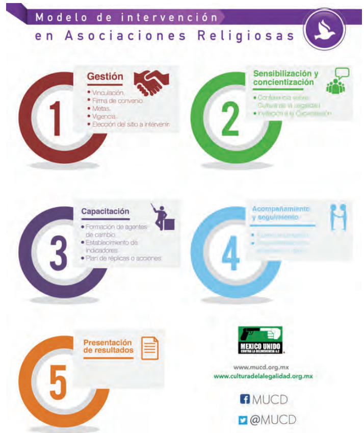
Imagen 1. Modelo de intervención en Asociaciones Religiosas