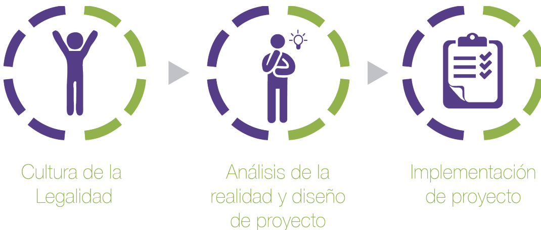
Imagen 1. Proceso de capacitación.