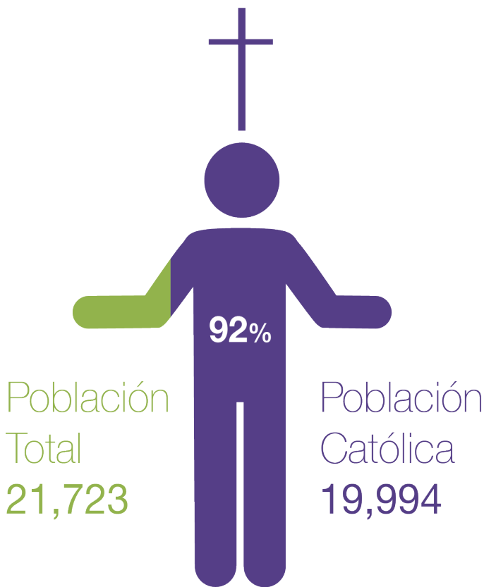
Gráfica 1. Población Católica en Michoacán