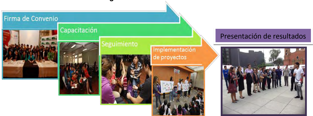
Diagrama de intervención