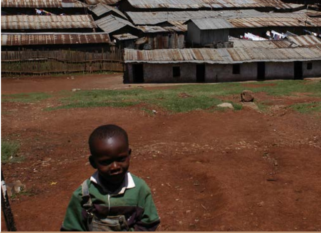
Los derechos de las y los niños han sido crecientemente violados a través de medidas para el control de drogas

La pregunta clave, al calcular los costos de la guerra contra las drogas respecto a los derechos de las y los niños, es ésta: ¿Son éstas “medidas apropiadas”, particularmente dados los resultados? (63)